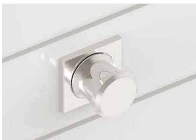
Hochwertiger Griff in Schwarz oder Metallfarben