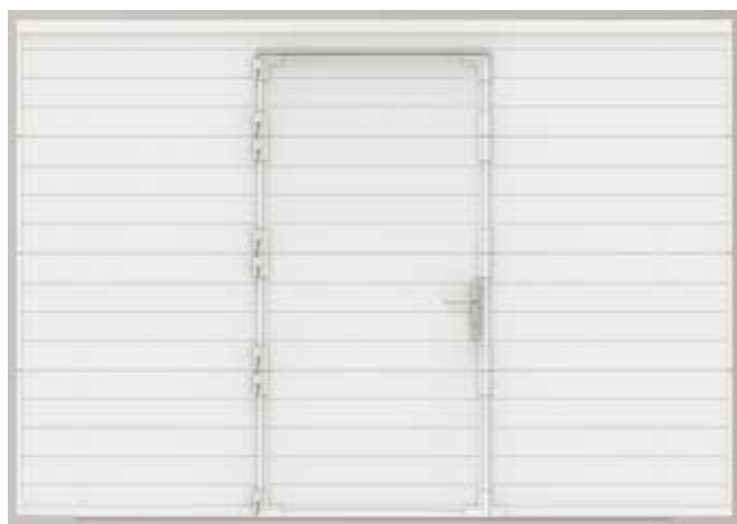
Schlupftür, niedrigere Schwelle. Die Innovation.