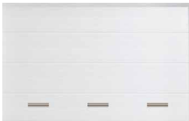
Tor mit 3 Lüftungsgittern.